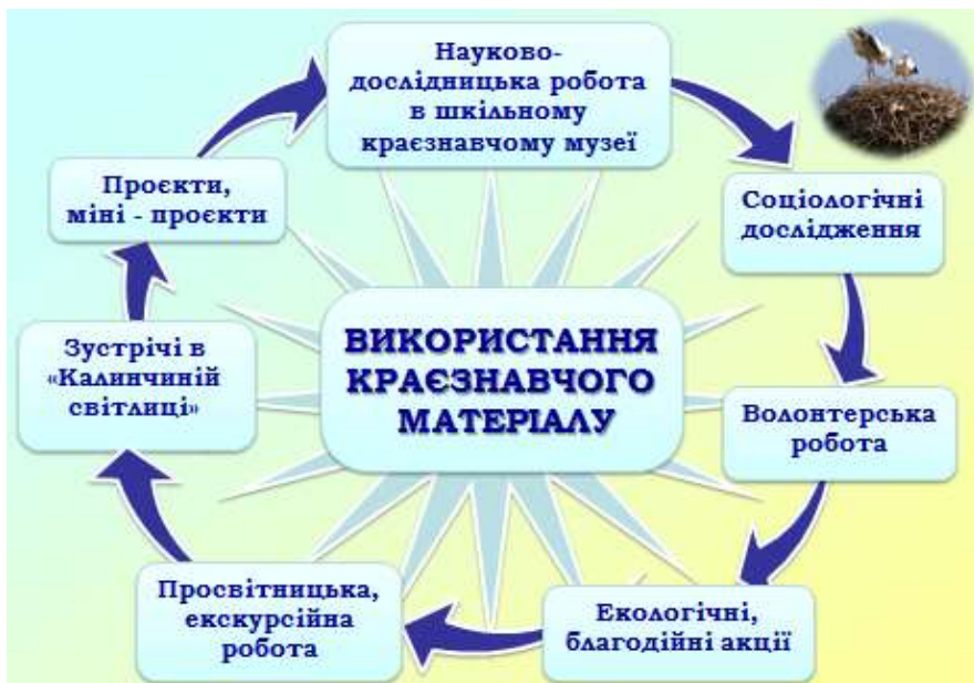
Рис. 3. Використання краєзнавчого матеріалу музею.

Архівні матеріали, фонди краєзнавчого музею, юні пошуковці використовують у доповідях на районних та шкільних краєзнавчих конференціях.