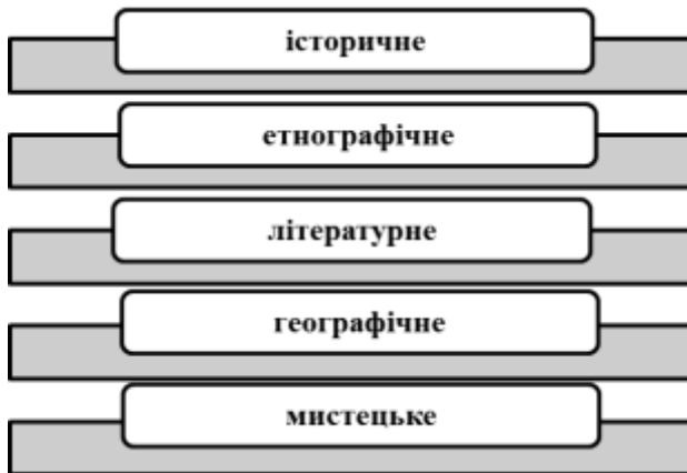
Рис. 4. Напрямки краєзнавчих досліджень.

Зупинимось на характеристиці деяких краєзнавчих напрямків :